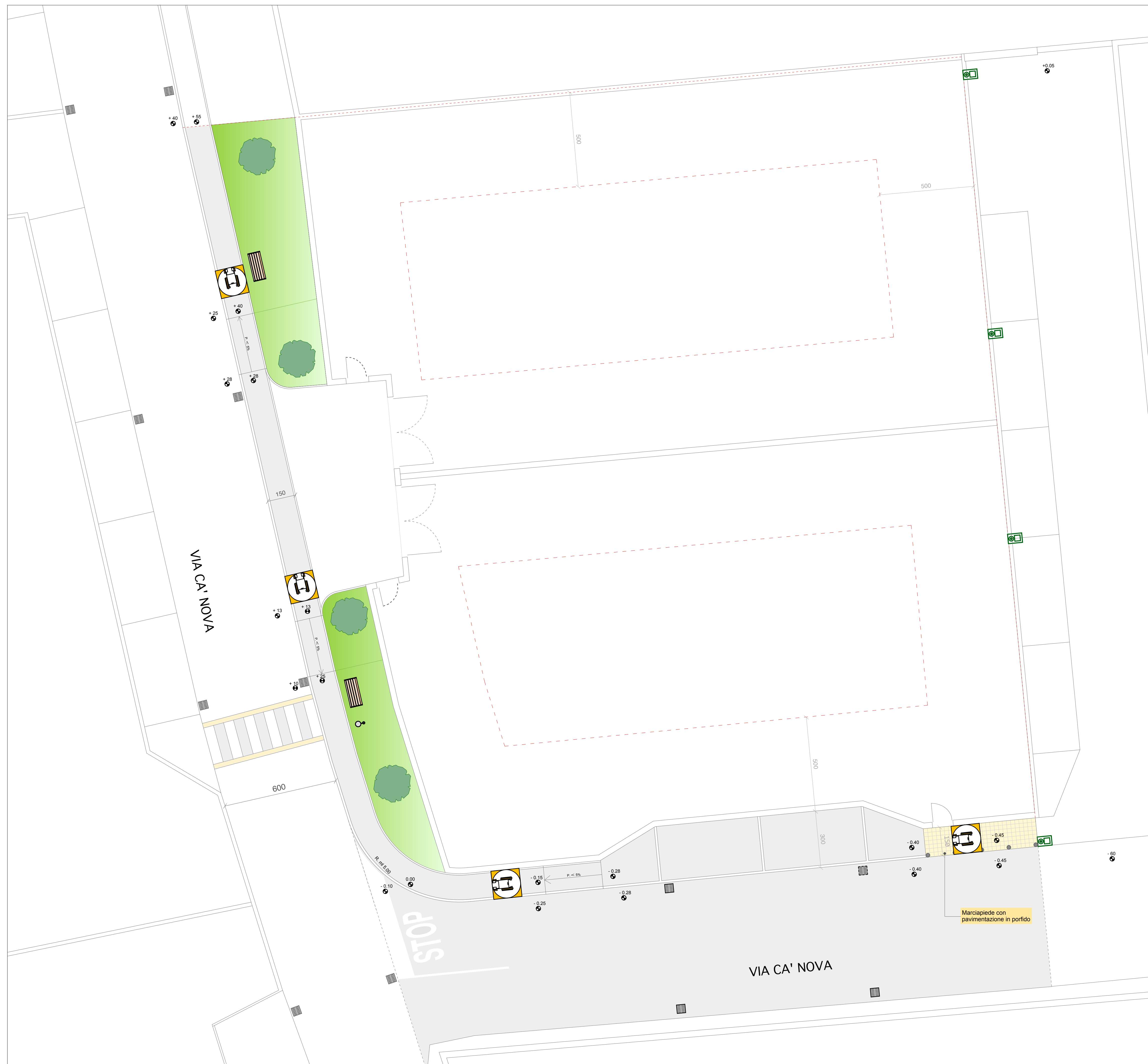
PLANIMETRIA GENERALE - SCALA 1:100 -

VIA VENEZIA, 96/C 36035 MARANO VIC. (VI) PARTITA IVA 0265255 024 1 Tel. 0445/560258 Cell. 3337491798 E-mail nygu@libero.it