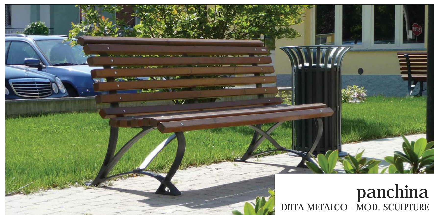
panchina DITTA METALCO - MOD. SCULPTURE