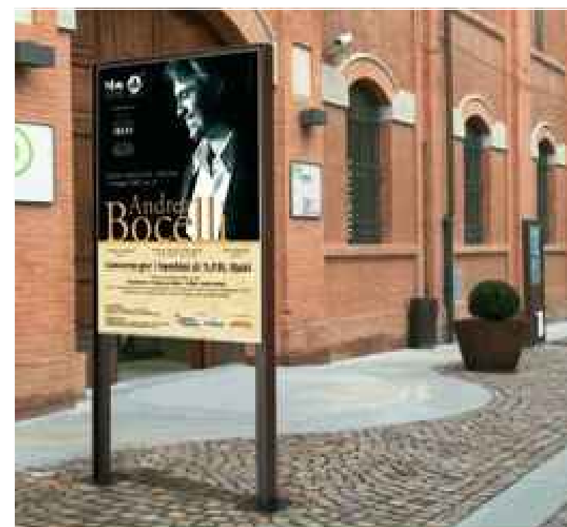
bacheca DITTA METALCO - MOD TARGA 100x140